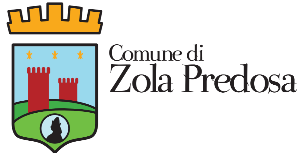
L'accostamento orizzontale di stemma e logogramma è indicato per riproduzioni medie e piccole

il font utilizzato per la composizione del logogramma è il PARMA PETIT può essere utilizzato nella composizione tipografica per titoli e sottotitoli