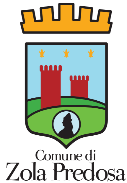
L'accostamento verticale di stemma e logogramma è indicato per riproduzioni grandi