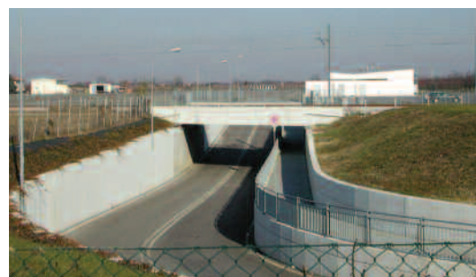
Sottovia stradale di accesso al Palazzola