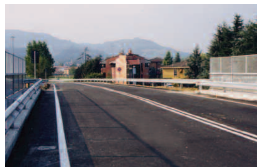
Cavalcaferrovia di via Rigosa