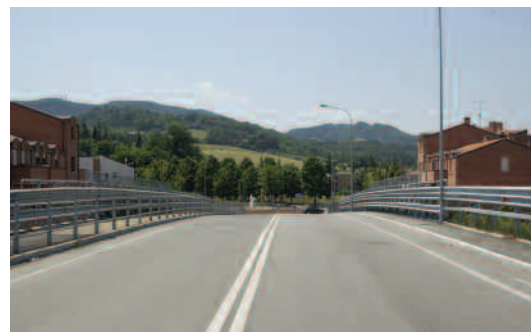
Cavalcaferrovia M. D'Antona