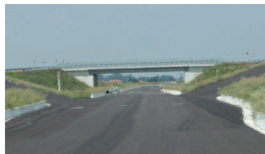
Cavalcavia di via Madonna Prati