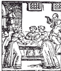
"IL MATTERELLO D'ORO" BOLOGNA

CENACOLO DI TRADIZIONI GASTRONOMICHE BOLOGNESI